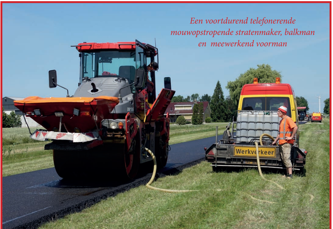
Een voortdurend telefonerende mouwopstropende stratenmaker, balkman en meewerkend voorman